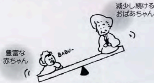
ヒアルロン酸やコラーゲンの量は年齢と反比例!!

私たちの体内には、ヒアルロン酸・デルマトン硫酸・コンドロイチン硫酸等のムコ多糖体があります。これらは分子量や存在する場所も違いますが、それぞれが美容と健康を維持するための重要な役割を担っています。特にヒアルロン酸は1グラムで6リットルの保水力があるとされていますが、加齢と共に減少するため、健康食品等で積極的に補いたいものです。